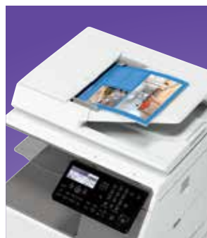
Színes hálózati szkennelés